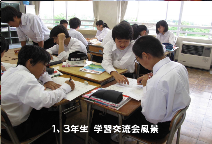
1、3年生 学習交流会風景